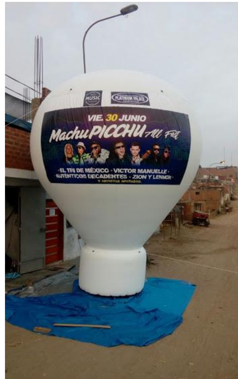
MACHU PICCHU ALL FEST 2017 – Publicidad