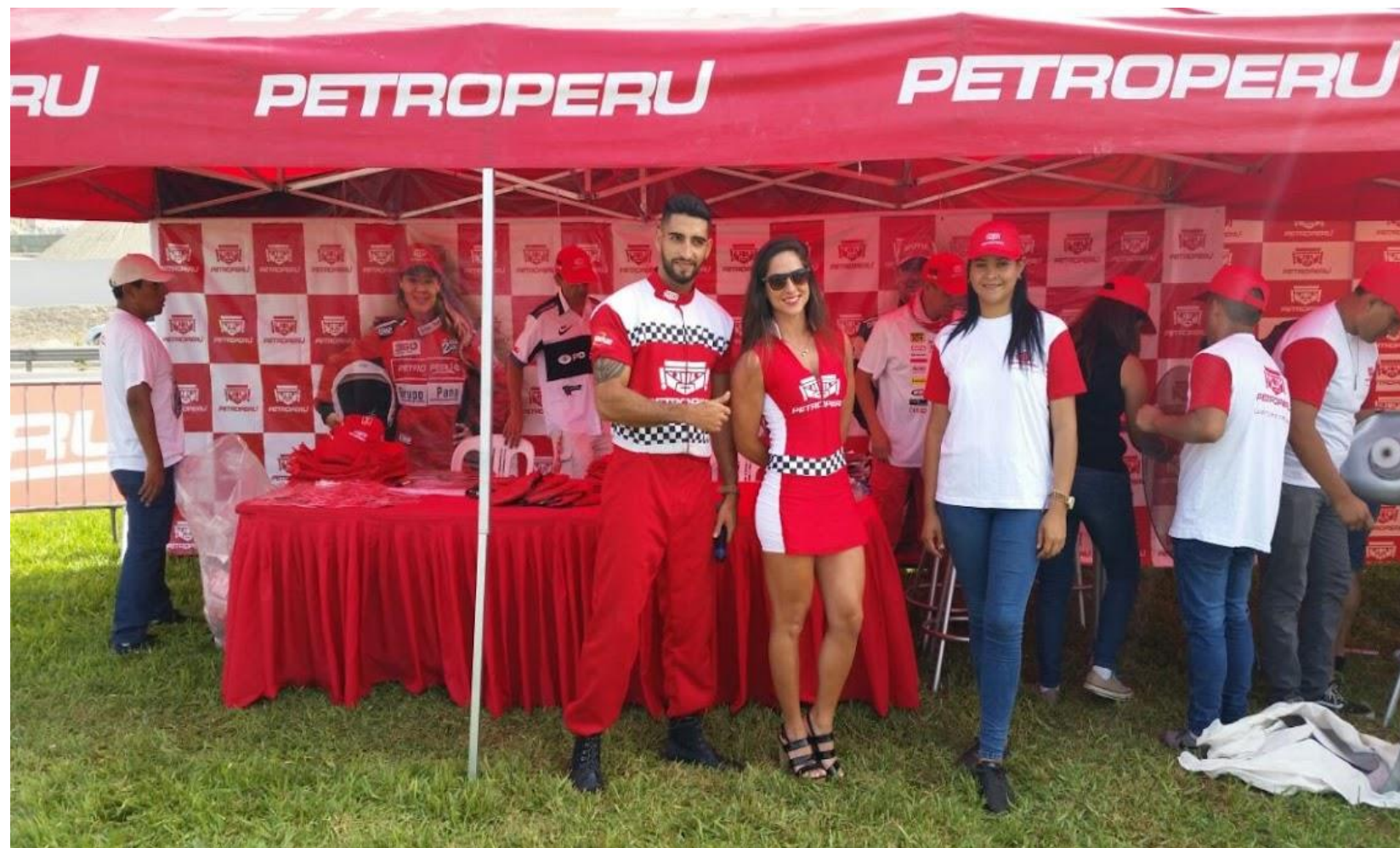
PETROPERU – Firma de Autógrafos DAKAR