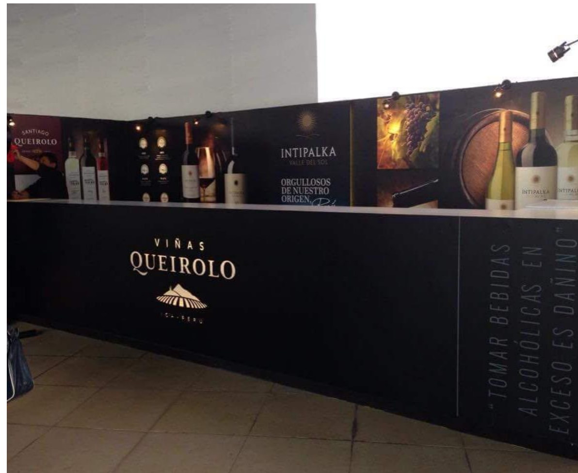
VIÑAS QUEIROLO – Barra EXPO VINO