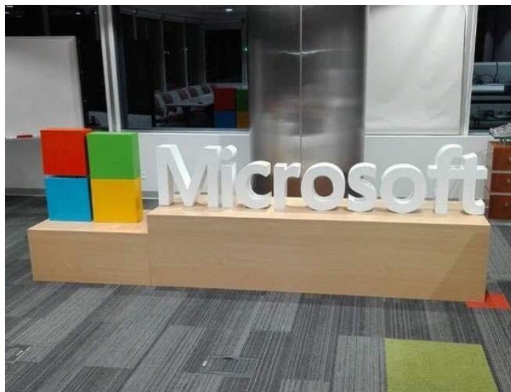
MICROSOFT – Letras Volumétricas