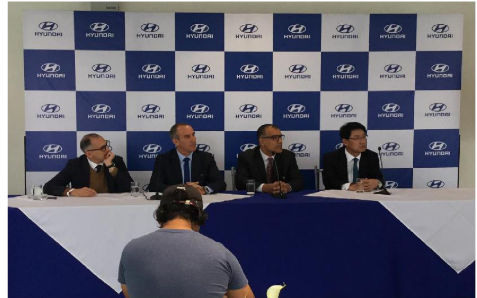
HYUNDAI – Conferencia de Prensa