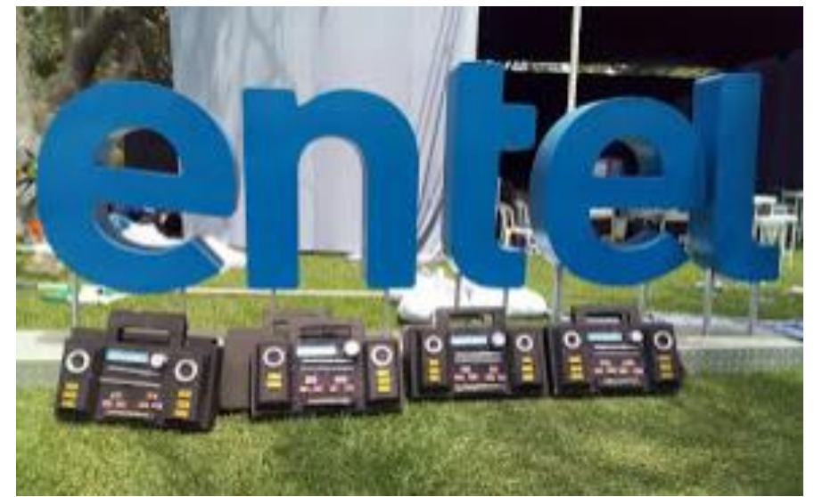
ENTEL – Dummies de Tocacassettes