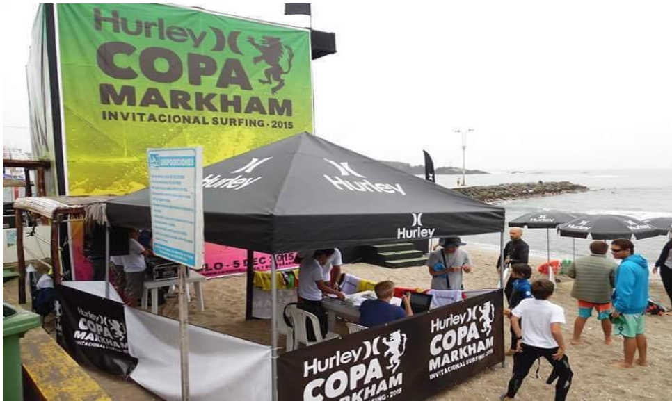
COPA MARKHAN – Pendones y Banners