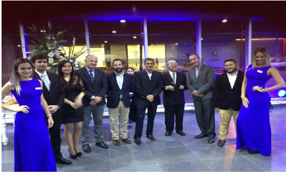
HYUNDAI – Inauguración AUTOCAM La Rambla San Borja