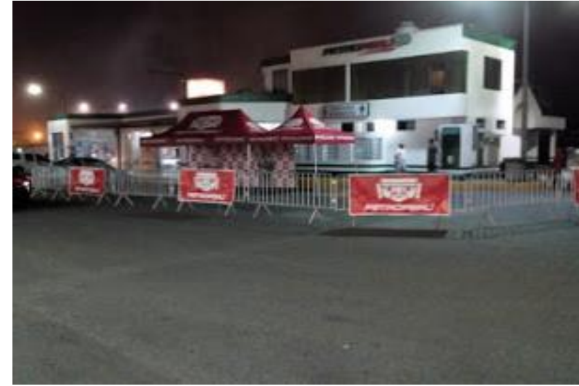
PETROPERU – Instalación de Activos