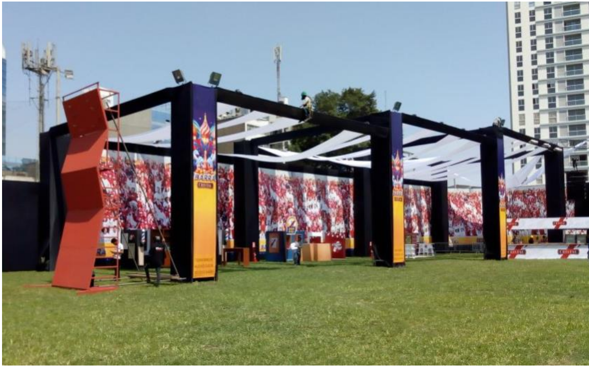
BACKUS – Estructuras