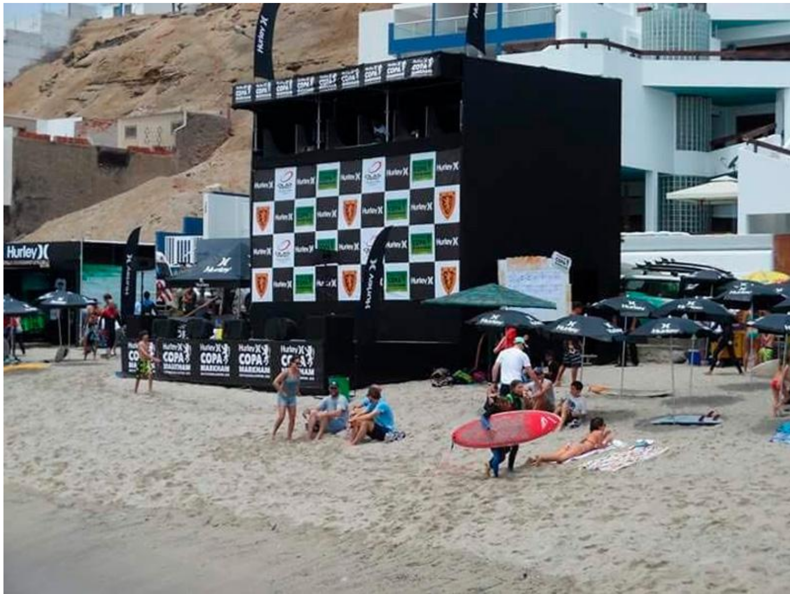
COLEGIO MARKHAM– Escenario