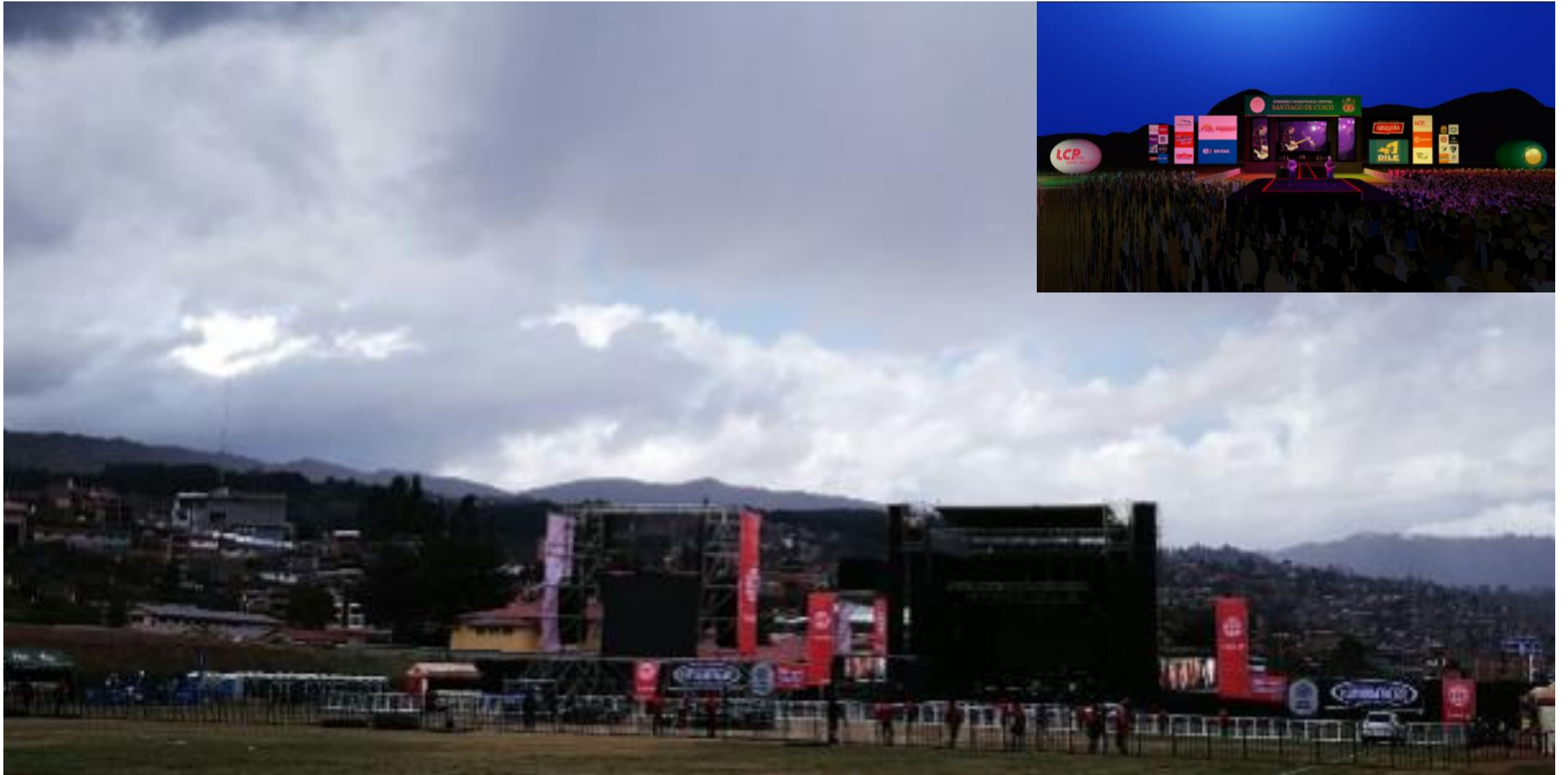
CUSCO-MACHU PICCHU ALL FEST 2017 – Diseño y Estructura - Armado