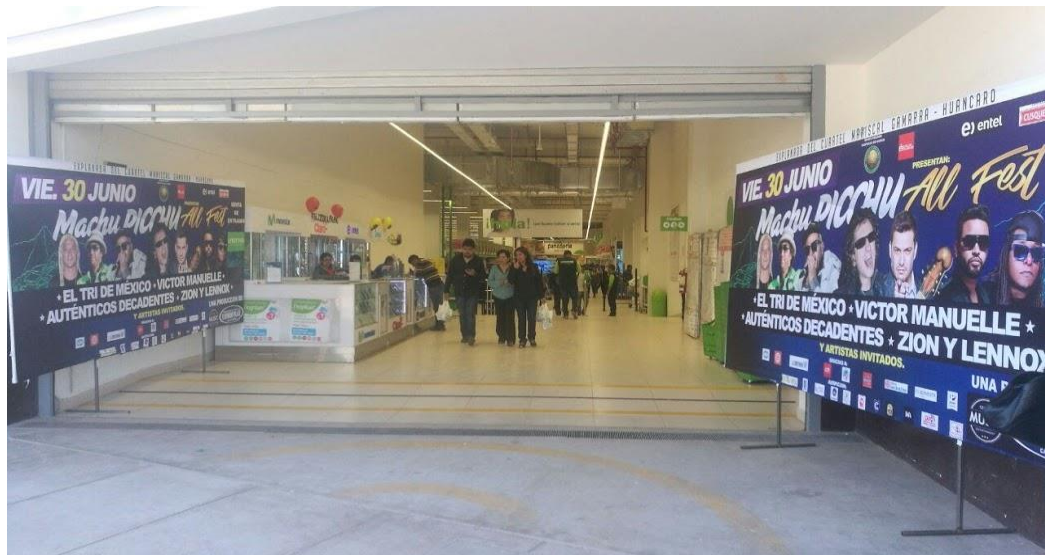
MACHU PICCHU ALL FEST 2017 – Publicidad