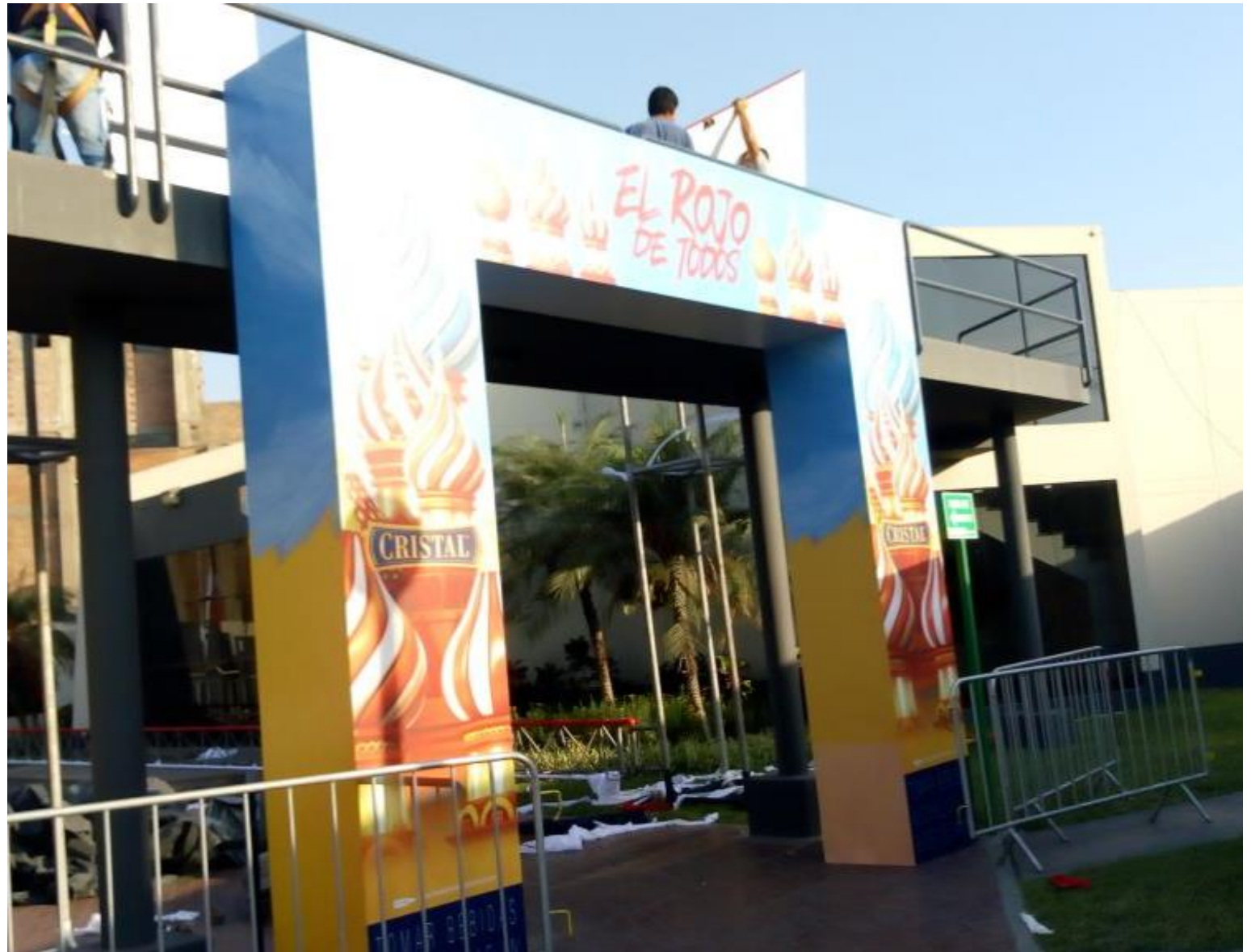
BACKUS – Pórtico Cerveza CRISTAL