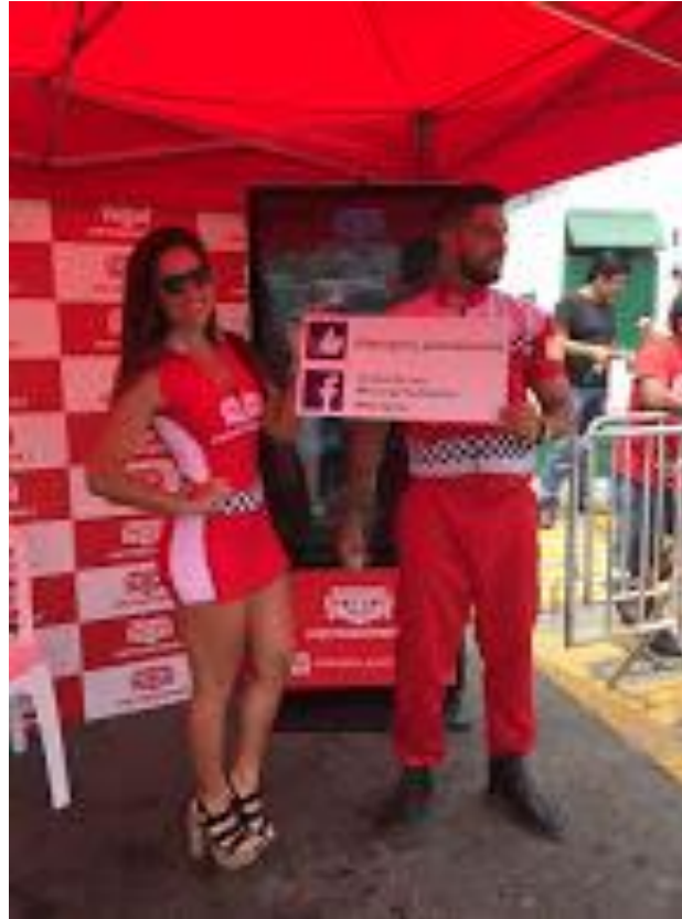
PETROPERU –Toma de Fotos