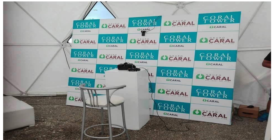
CARAL – Backing