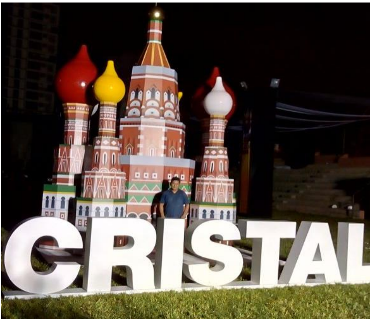
BACKUS – Letras Volumétricas