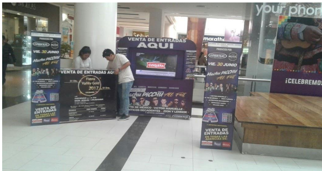
MACHU PICCHU ALL FEST 2017 – Puntos de Venta