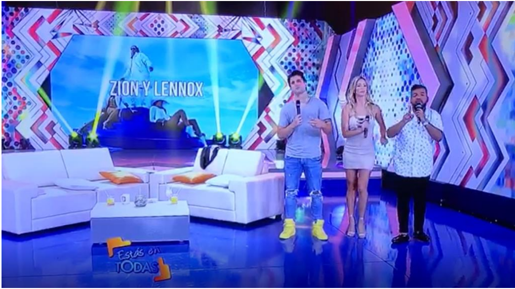
MACHU PICCHU ALL FEST 2017 – Estas en Todas – America TV