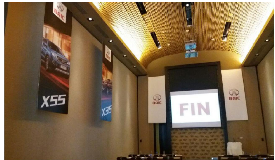
HYUNDAI – Lanzamiento BAIC X35 – X55 - Paracas