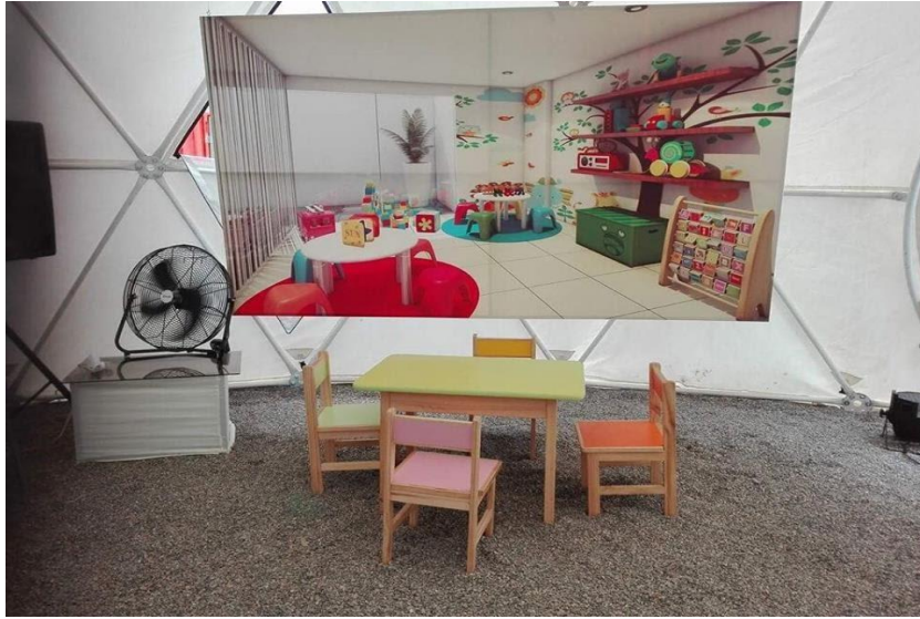
CARAL – Ambientación de Evento