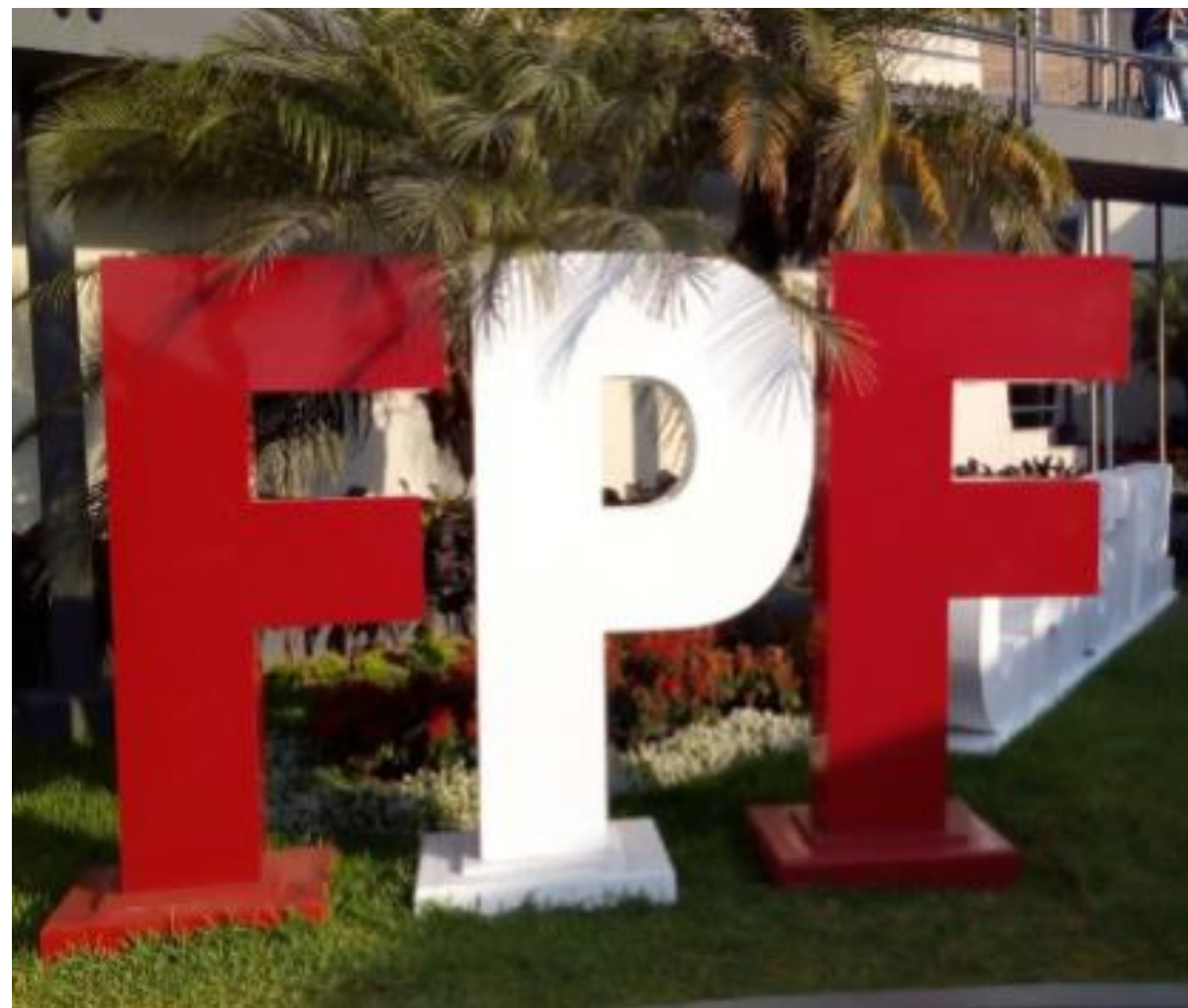
FPF – Letras Volumétricas