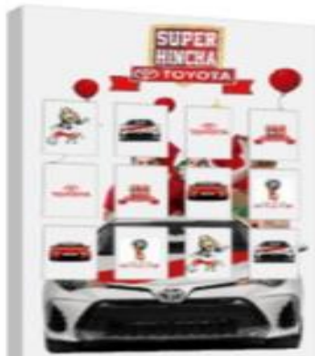
TOYOTA- Juego Memoria con fichas intercambiables según temática