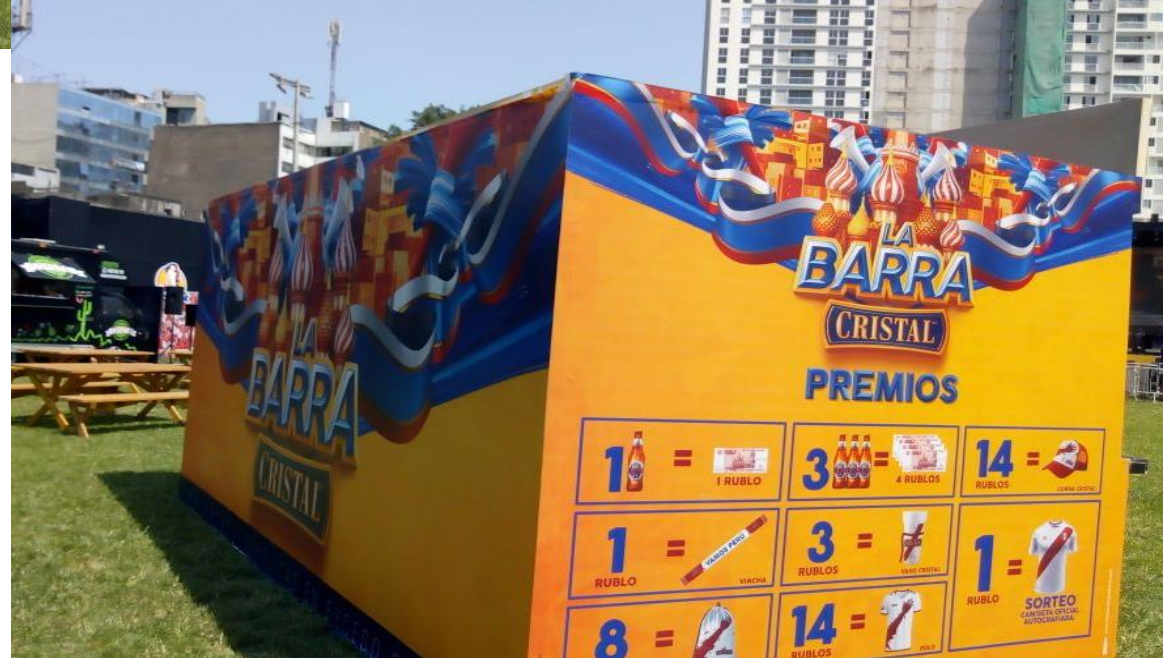
BACKUS – Brandeo de Kiosko