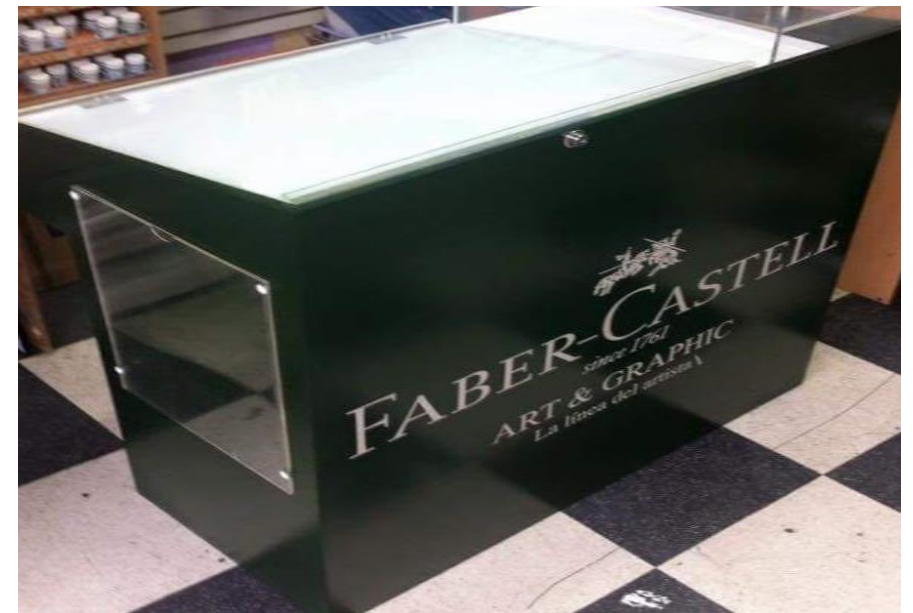
FABER CASTELL – Mesa de Dibujo