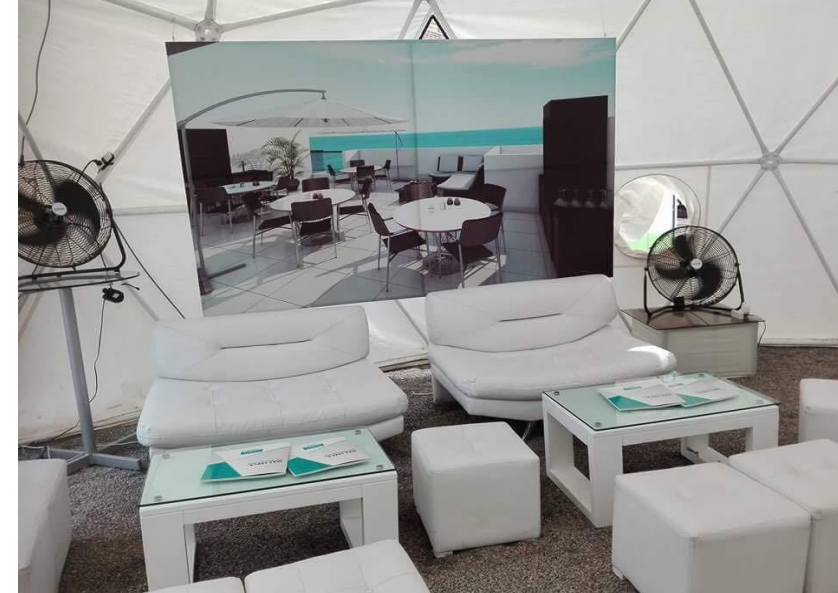
CARAL – Ambientación de Evento