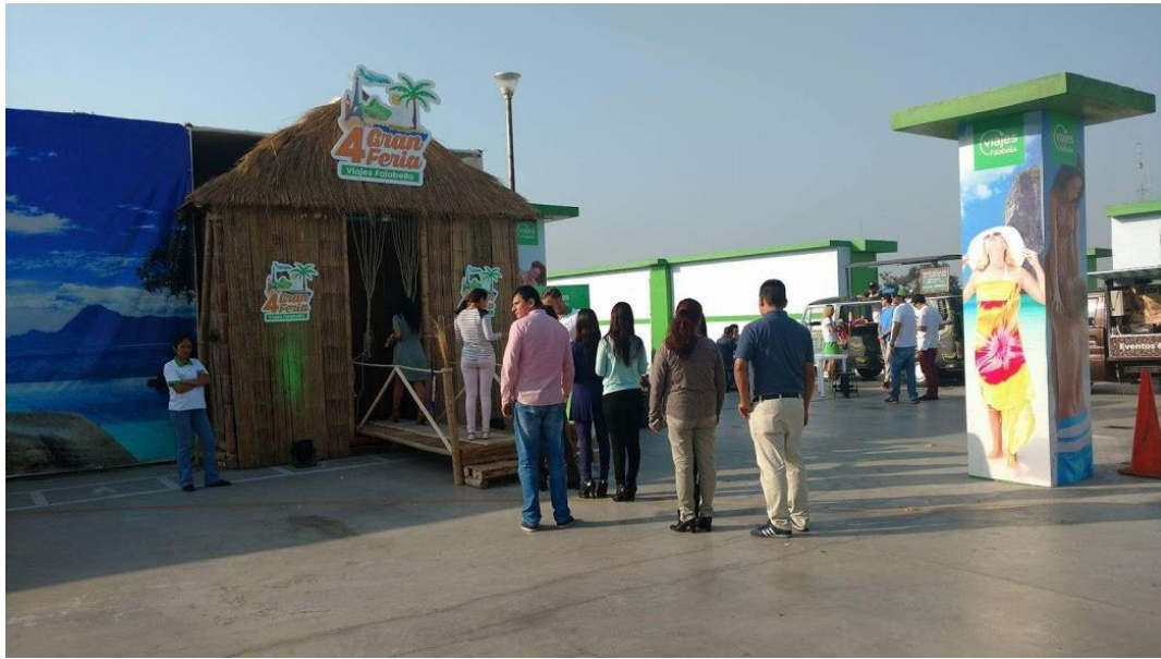
VIAJES FALABELLA – Implementación de Activos