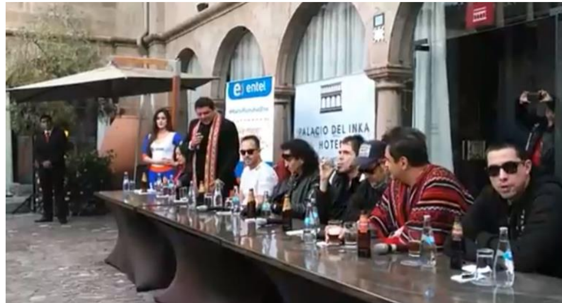
MACHU PICCHU ALL FEST 2017 – Conferencia de Prensa