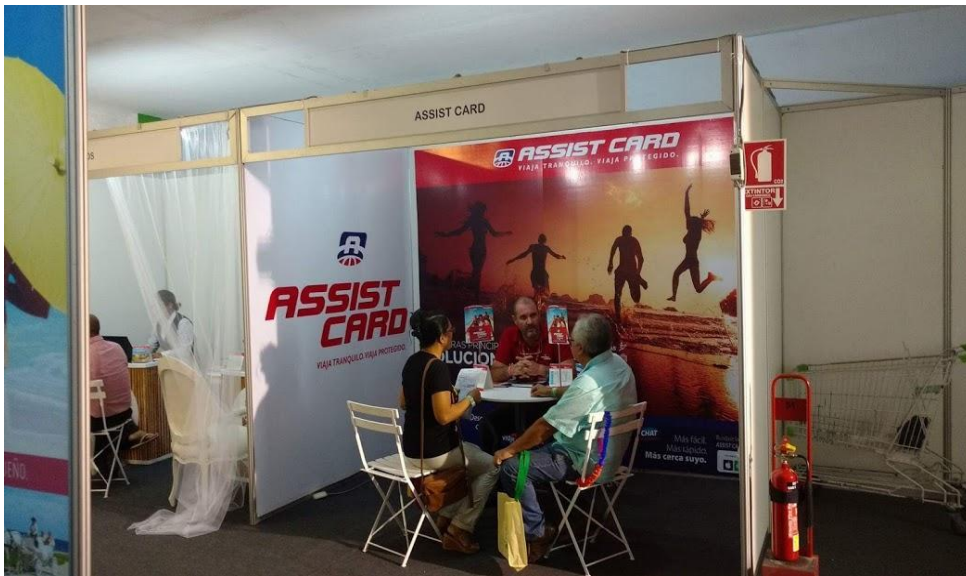
ASSIST CARD – Brandeo de Stands