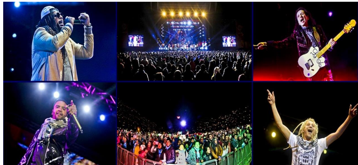
CONCIERTO EN CUSCO-MACHU PICCHU ALL FEST