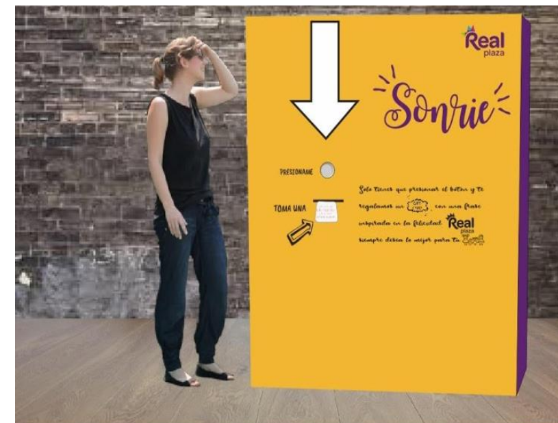
MAQUINA EXPENDEDORA DE TARJETAS CON FRASES INSPIRADORAS