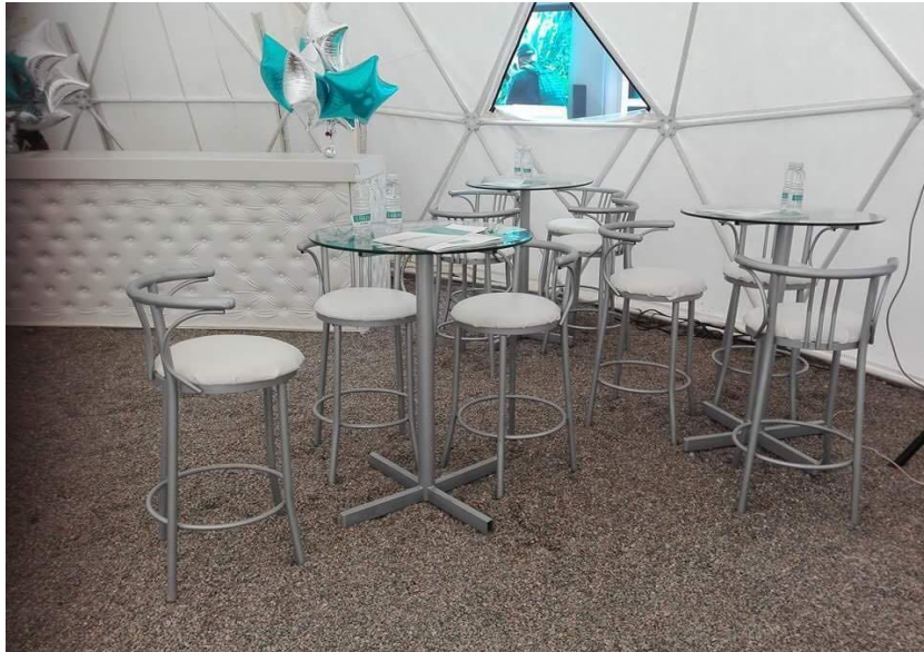
CARAL – Ambientación de Evento