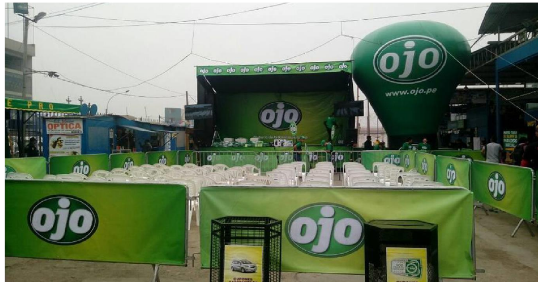
OJO – Implementación de Activos – Implementación Grafica