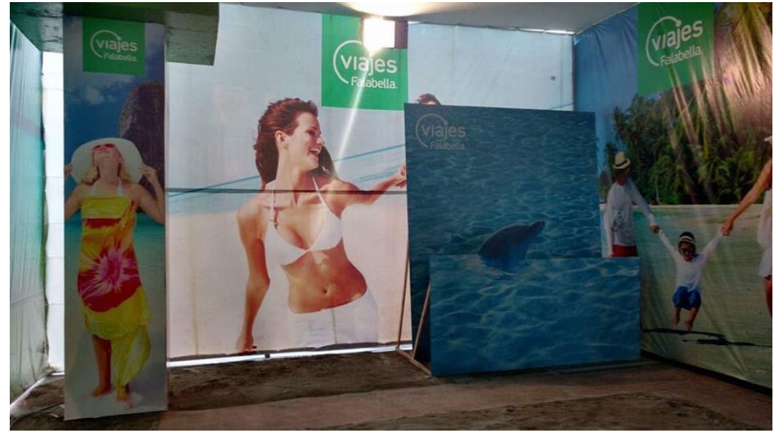
VIAJES FALABELLA – Backing