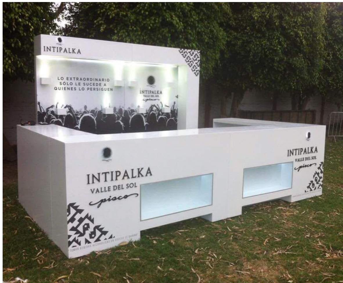
INTIPALKA – Barra Fiesta Halloween Las Palmas