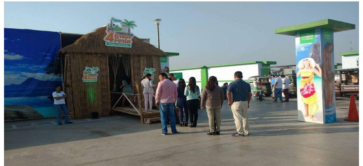
VIAJES FALABELLA – Brandeo de Columnas