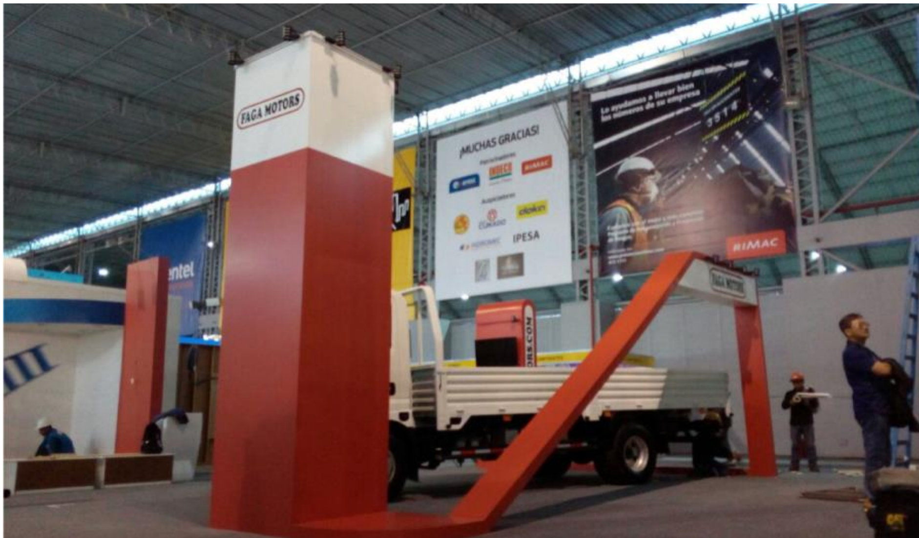
FAGA MOTORS – Stand EXPO ARCON 2017