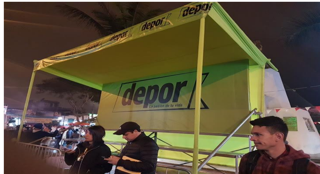
Implementación Gráfica - Banners