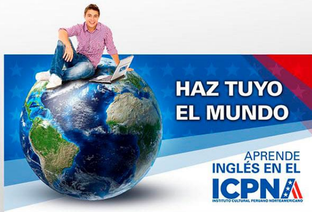
KV de Campaña