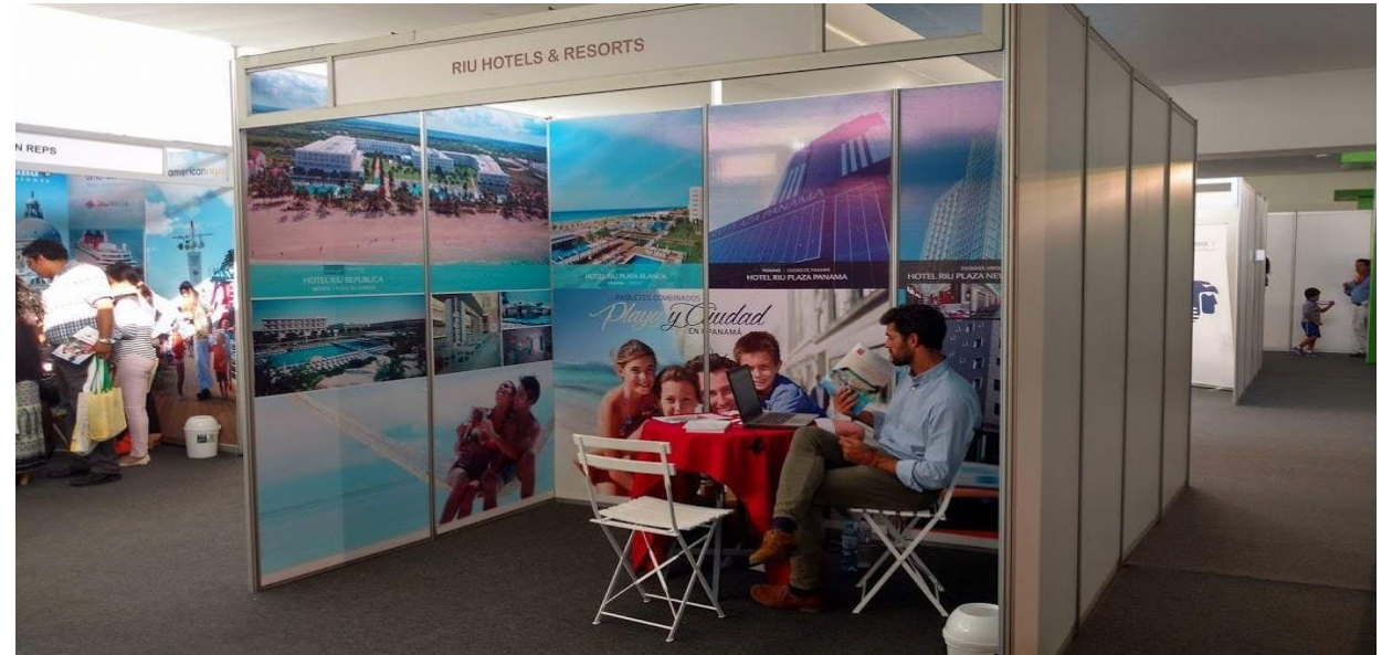
VIAJES FALABELLA – Brandeo de Stands