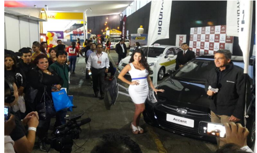
HYUNDAI – Expo Taxi 2017