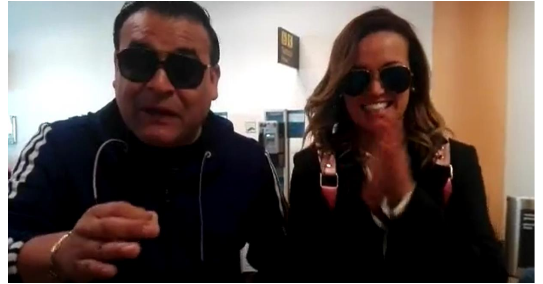
MACHU PICCHU ALL FEST 2017 – La Previa– America TV