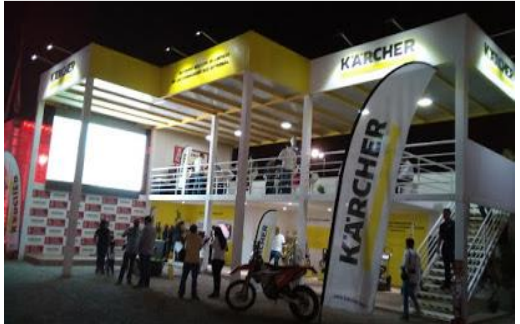
KARCHER - Stand DAKAR 2018